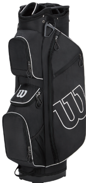
ブラック/ホワイト