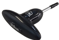
《トルクレンチ付き》