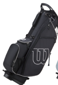
ブラック/ホワイト