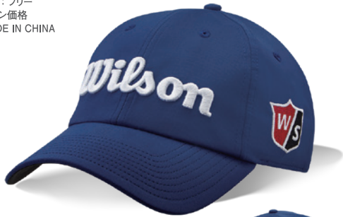
ネイビー / ホワイト