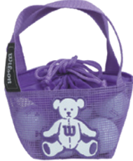
ホワイト(ネット8ヶ入り) (37337)